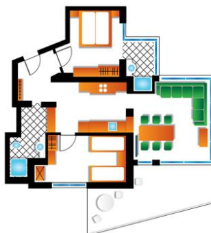
4 Personen Apartment - Atrium