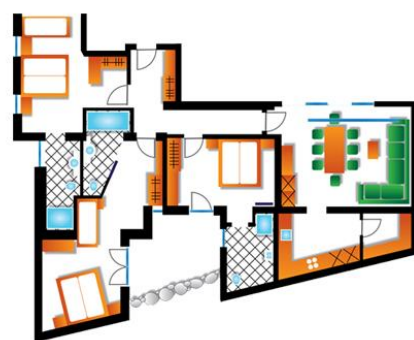
10 Personen Apartment - Down Under