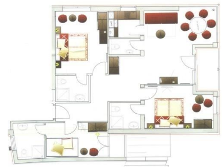
Beispiel 7-8er Apartment mit Balkon