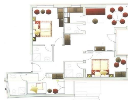
Beispiel 7-8er Apartment mit Balkon