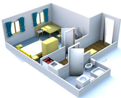
2 Personen Apartment

Apartment mit 2 Schlafzimmern, ein Zimmer mit 2 Einzelbetten von denen 1 verbreitert werden kann inkl. Dusche/WC, ein Zimmer mit Doppelbett plus Schlafcouch, Dusche, WC, Küche mit Essbereich