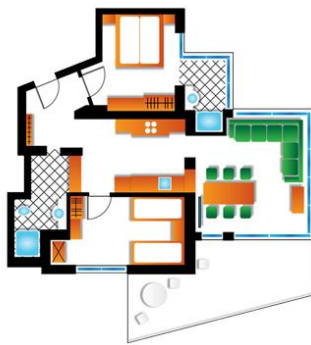
4 Personen Apartment - Atrium