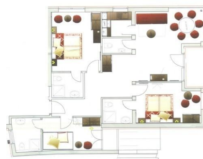
Beispiel 7-8er Apartment mit Balkon