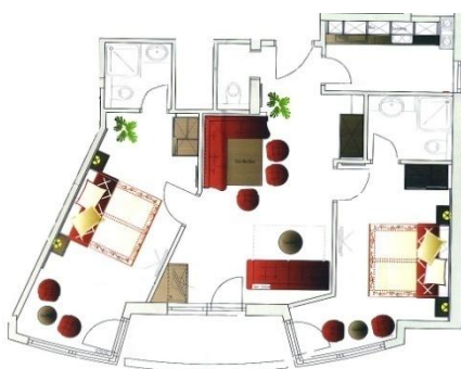
Beispiel 6er Apartment mit Balkon