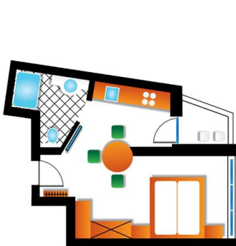
2 Personen Apartment - Privacy

2 Schlafzimmer mit Doppel- und Einzelbett mit Bad (große Dusche/WC, bzw. Badewanne/WC), 1 Schlafzimmer mit Doppelbett und Bad (Dusche/WC), Wohn-/Schlafbereich mit Schlafsofa für 2 Personen und Esstisch, vollausgestattete Küche mit Abstellraum.